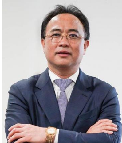
អ្នកឧកញ៉ា គិត ម៉េង ប្រធានក្រុមប្រឹក្សាភិបាល