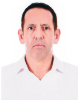
លោក Raymond Thornton Yager អភិបាល